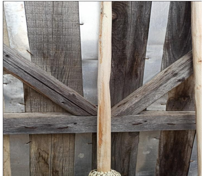
Fotoğraf 17: Süpürge Sapını Hazırlama İşlemi ve Süpürge Demetine Çakılmış Sap Örneği

2.6. Halka: Çalıların demet haline getirilmesi, demetin orta kısmına findık ağacından yapılan bir sapın çakılması işlemlerinden sonra sıra bir halka hazırlamaya gelmektedir. Halka, kolay şekil alması nedeniyle findık ağacının kabuğundan yapılmaktadır. Uygun bir findık dalı seçilir ve dalın üzerine bıçak yardımıyla çizik atılır. Bu işlemler sonucunda findık dalının kabuğu soyulur ve bir