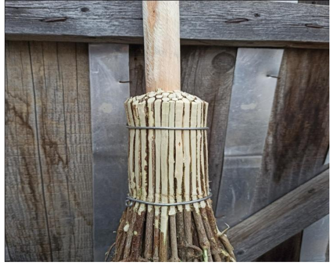
Fotoğraf 16: Demir Çubuk İle Sıkıştırma İşlemi ve Tel İle Bağlama Örneği

2.5. Sap Çakma: Sap çakma aşamasında vevv şekilde kesilen ve 80-85 tane çalının bir araya getirilmesi sonucunda oluşturulan demetin ortasına findık ağacından elde edilen bir sap kısmının çakılması işlemine geçilir. Keser yardımıyla findık ağacının köklerinden birisi çalı süpürgesinde kullanılmak üzere kesilir. Kesilen bu ağaç, sap olarak kullanılmadan önce dallarından ve kabuğundan balta ve törpü yardımıyla temizlenir ve hazır hale getirilir. Sapın findık ağacından yapılmasının nedeni ise findık ağacının daha kolay şekil alabilmesi ve çalı süpürgesi için daha uygun olmasıdır. 1.5 metre uzunluğunda hazırlanan ve demetin ortasına çakılan sapa sabit kalabilmesi için bir çivi çakılmaktadır.