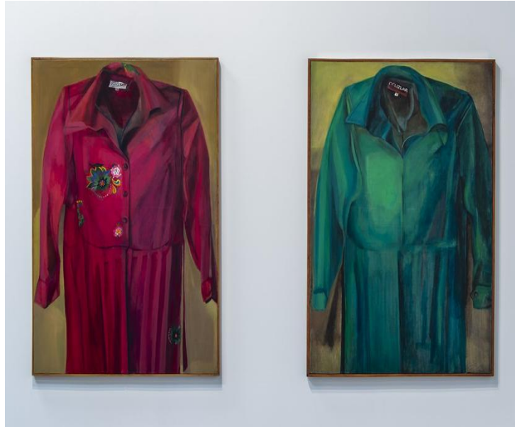
5. Şekil: İpek DUBEN 'Şerife' Eseri 5

Duben'n "Onlar" isimli enstalasyon çalışması da farklı uyuğa sahip 24 bireyin söylemlerinden oluşmaktadır. Birbirinden farklı dilde konuşan, farklı inanışlara sahip olan ve farklı cinsel yönelimleri olan bu bireyler kurgulanmış bir sergi mekânında bir araya getirilmiştir. Bu sergi salonunda tavandan sarkıtılan perdeye bireylerin görüntüsü yansıtılmaktadır. Ortam karartılarak sadece bireylerin vücutlarına yansıtılmış beyaz bir ışıkla aydınlatılmaktadır. Bireylerin anlatılarını dinlemek için tam karşılarında durmak gerekmekte, uzaklaştıkça kulak tırmalayan bir uğultuya dönüşmektedir. Duben anlatılanların dikkatle dinlenmesi ve seyircinin empati kurabilmesi için etkili bir yöntem sunmaktadır. Farklı geleneksel anlayışlara sahip bu bireyler aile içinde ve sosyal hayatta maruz kaldıkları zorbalıkları seyirciye ve birbirlerine aktarmaktadır. Duben koreografisini daha önce hiç bir arada bulunmamış bu bireylerin, maruz kaldığı toplumsal cinsiyet kalıp yargılarının yaşattığı travmaları aktardıkları, gerçekte var olmayan bir mekânda gerçekleşmektedir. Duben'in bu enstalasyonda asıl amacı ayırım gözetilmeksizin her bireye kendini özgürce anlatma fırsatı sunmaktır. Enstalasyon iki ayrı perdeden oluşmaktadır. Bir perdede ırkçılık, cinsiyetçilik gibi konulara değinilirken diğer perdede bireylerin kendi yaşamlarını anlatabildikleri, iç sesinin dışa yansması şeklinde anlatılmaktadır.