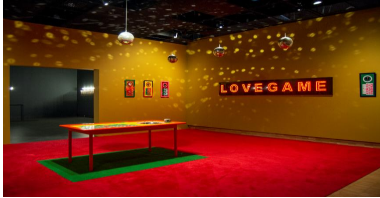
10. Şekil: İpek DUBEN 'LOVEGAME' Eseri 10

malzeme sunulmaktadır. Çalışma 54 plakadan ve bu plakaların üzerinde de yakın kadının ana rolde olduğu 200'e yakın vaka bulunmaktadır. Peş peşe giden plakalar izleyicilere sanki sonsuza kadar gidecekmiş duygusunu vermektedir. Adeta "Bu böyle gelmiş böyle gider" anlamında bir mesaj verilmek istenmiştir. Plakaların telefon kulübesi şeklinde düzenlenmesindeki asıl amaç ise izleyicinin kafasını sokarak okumasını zorunlu kılmaktır. Duben toplumsal cinsiyet eşitsizliğinin büyük oranda kadına uygulandığı ve bunun sonuçlarının çok ağır ve insanlık dışı olduğunu anlatmak istemiştir. Bu sıralı plakalar her gün gazete haberlerinin bir parçası olarak görmeye alışkanlık kazanılan bu haberlerin aslında bir farkındalık yaratma, karşıt bir hareket oluşturma amacıyla okunması gerektiğinin de mesajını vermektedir.