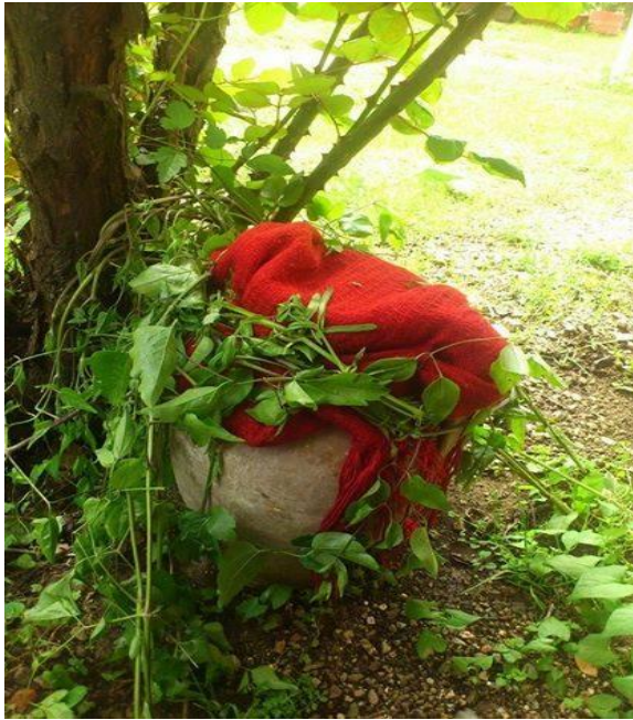
Şekil 2: Valandova Bölgesi Martufal Çömleği

Martifal âdetindeki vazgeçilmez olan uygulamalardan en önemlisi görüldüğü üzere mani söyleme pratiğidir. Ancak bu dönemde söylenen Martifal manilerinin sihri bir fonksiyonunun da bulunduğu inanılır. Söylenen manilere göre kişinin ya da kişilerin bahtlarının devam eden sene boyunca belirlenmiş olacağına inanılır. “Yani küpe atılan her nişan için söylenen mani, bir yıl zarfında olagelen olayları yani kişinin bahtlı ya da bahtsız olacağını öğrenilmesi için söylenen manilerdir.” 84