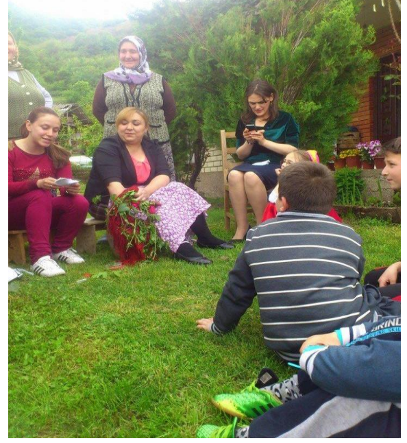
Şekil 5 : Konçe'de kadınlar Martufal çekerken.

Konçe'den, Valandova'nın Çalıkılı ve Bahçebosu köylerinden gerçekleştirdiğimiz saha çalışmaları esnasında derlediğimiz “Kısmet Kapama” ve “Martufal Çekme” adetlerine dair okunan manileri, çalışmamıza ağız özelliklerini de bozmadan aynen alıyoruz. Bazıları şunlardır: