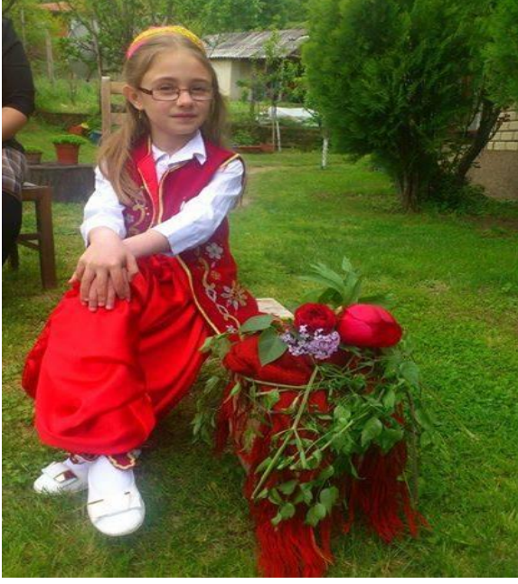
Şekil 4: Konçe'de Martufal kızı ve çömleği.