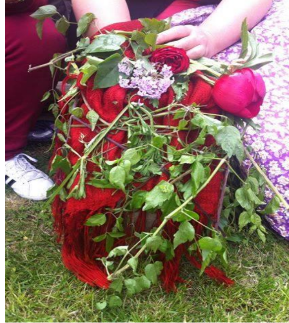
Şekil 3: Konçe'de Hidrellez Otu Sarılı Martufal Çömleği