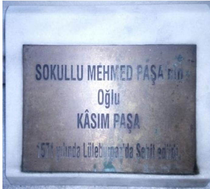
2. Fotoğraf: Kasım Paşa'nın mezar taşının altında yer alan Lüleburgaz'da şehit edildiğini gösteren Latin harfli levha