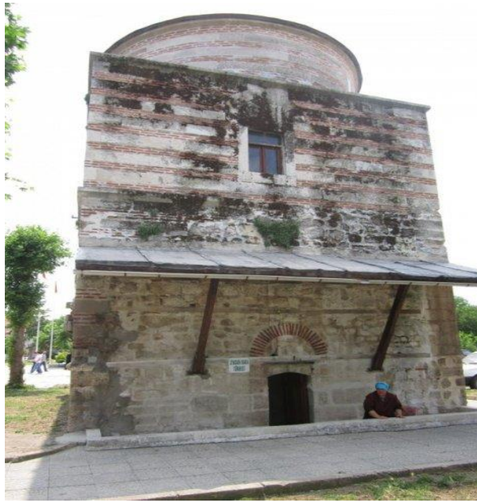
4. Fotoğraf: Zindan Baba Türbesi'nin bugünkü durumu.