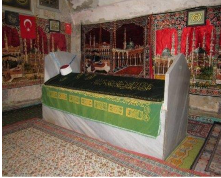
5. Fotoğraf: Zindan Baba Türbesi'nin içi.