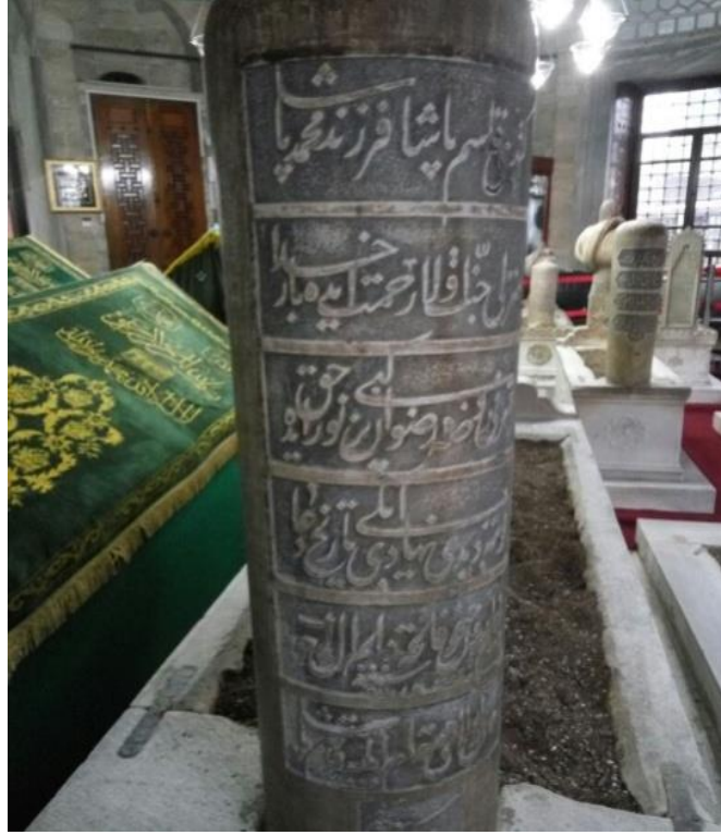
1. Fotoğraf: Kasım Paşa'nın Eyüp'te bulunan Sokullu Mehmet Paşa Türbesindeki mezar taşı.