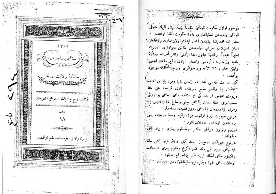
2. Şekil: H.1309/M.1892 tarihli Edirne Vilayeti Salnamesi ( http://ktp.isam.org.tr/salname/sayilar.php?sidno=D02471 )