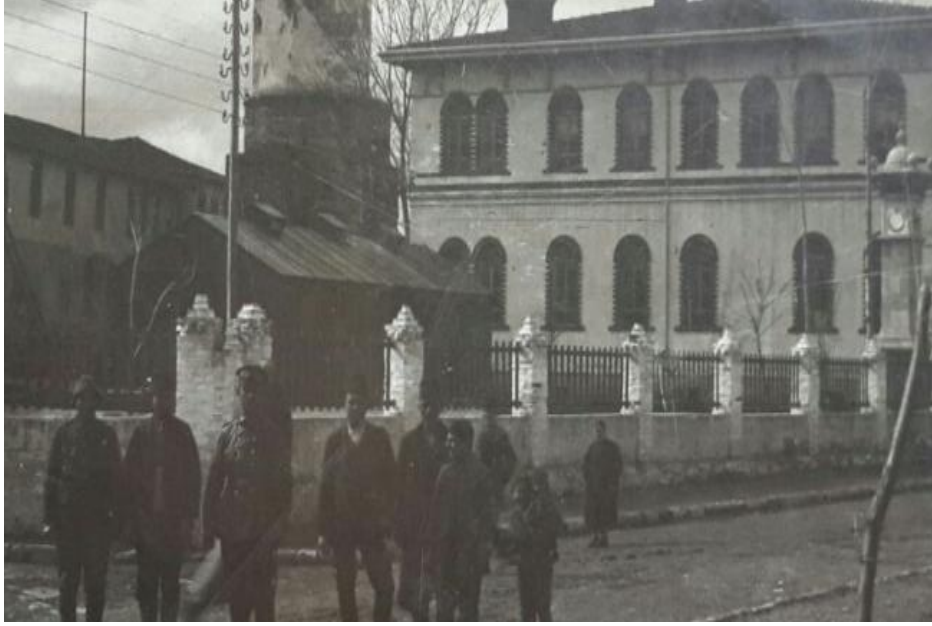
3.Fotoğraf: Sokullu Mehmet Paşa tarafından yaptırılan fakat günümüze ulaşamayan konak (sağda) ve eskiden saat kulesi olarak da kullanılan Zindan Baba türbesi (ortada).