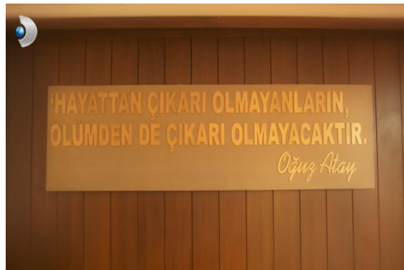
Görsel 3: Poyraz’ın Yaşam Mahkemesi (13. Bölüm, 0.16.11: 2015; Atay, 2015: 201)