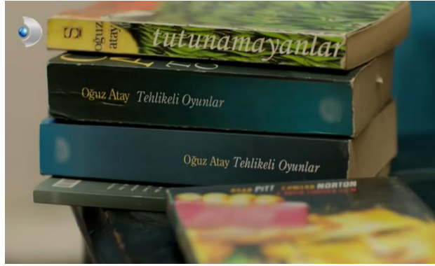
Görsel 1: Kadraja Giren Oğuz Atay Eserleri (62. Bölüm, 2.56.00: 2016)

Bu çerçevede Poyraz Karayel dizisinin Tutunamayanlar romanıyla kurduğu medyalararasılık ilişkisi şu biçimde değerlendirilebilir: Dizide Oğuz Atay’a ait kitaplar bilinçli kamera açılarıyla görünür kılınmakta, böylece doğrudan yazara gönderme yapılmaktadır. Ayrıca, bazı sahnelerde karakterlerin Atay’ın eserlerinden pasajlar okuması, yazarın dizinin ana tematik yapısını etkileyen bir figür olarak konumlandığını düşündürmektedir. Bununla birlikte, baş karakter Poyraz’ın kitaplığında Atay’ın kitaplarının yer alması ve bu kitapların arasına para ya da önemli belgeleri gizlemesi gibi detaylar da bu etkileşimi pekiştiren anlamlı göstergeler arasında yer almaktadır (Pekgöz vd. 2020: 194).