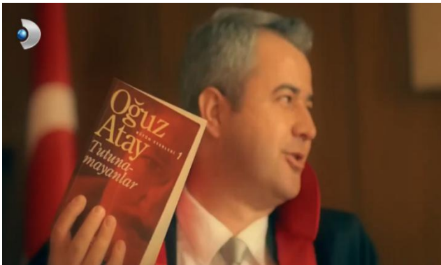
Görsel 2: Poyraz’ın Yaşam Mahkemesi (13. Bölüm, 0.18.49: 2015)

Oğuz Atay’ın Tutunamayanlar adlı romanı ile Poyraz Karayel dizisi, üretildikleri dönemler, mecralar ve biçimsel sunum farklılıklarına rağmen, postmodern anlatı anlayışı çerçevesinde derin bir kuramsal yakınlık sergilemektedir. Bu iki anlatı, yalnızca postmodern edebî veya görsel teknikleri kullanmakla kalmayıp aynı zamanda toplumsal dönüşüm süreçlerinin merkezinde yer alan bireyin parçalanmış kimliğini, “tutunamayan” erkek figürü üzerinden anlamlandırmaya çalışmaktadır. Bu figür hem Atay’ın metninde hem de televizyon anlatısında, modernleşmenin birey üzerindeki baskılayıcı ve yabancılaştırıcı etkilerinin bir tür temsilcisi olarak işlev görür.