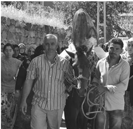
Niğde Fesleğen Köyü gelin alma

Niğde'de kızı baba evinden alarak, oğlan evine götüren; eskiden atlı ve silahlı olan kişilere “seğmen” / “seymen”; bu kişilerin oluşturduğu topluluğa “seğmen alayı”; seğmen alayının gelin kızı baba evinden almak için yola çıkmasına ise “seğmen kaldırma” ismi verilmektedir. Al duvak örtülü kız, baba evinden çalgılar eşliğinde gelen seğmen alayı ile alınır ve yol boyunca ona seğmenler eşlik eder. Akriba erkekler ve köy delikanlıları seğmen alayını oluşturmakla birlikte, onlara eşlik eden kadın erkek tüm köy halkına da genel olarak seğmen alayı denilebilmektedir. Bu durum, yani tüm düğün alayına seğmen alayı denilmeye başlanması, zaman içinde yaşanmış bir değişimdir. Seğmen alayındaki atlı, elinde silah olan kişilere “seğmenci” denildiği de görülmektedir. (Beyhan 1997: 151).Görüşme gerçekleştirdiğimiz Niğde Çukurkuyu Köyü'nden Mustafa Durukan, “Eskiden seğmenlerin hepsinin belinde ya da elinde silah olur ve kız evine varana kadar iki taraf karşılıklı silah atarlardı” demektedir (KK 8).