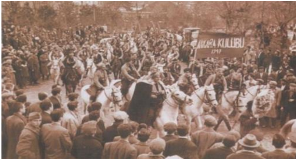
1940-1950’li yıllarda Seymen Alayı