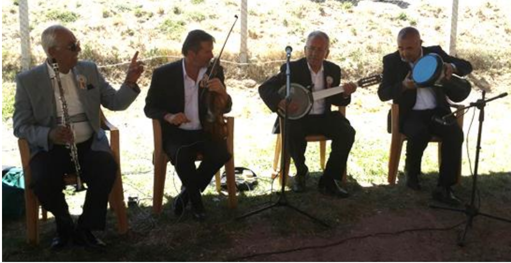
Niğde düğün ve eğlencelerinde yer alan tam takım – Niğde/Altınhisar