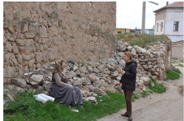
Niğde Gölcük-Akkız Hanım ile sohbet