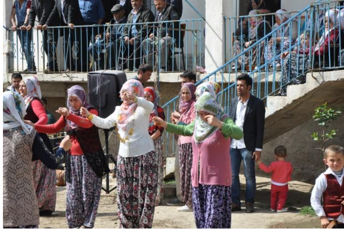
Niğde Orhanlı Düğününden

Seğmenlerin gelin kızı almaya gittikleri evin bahçesindeki eğlencelerde ve daha sonra erkek evinde çalan bağlama, kökenleri binlerce yıllık geçmişe dayanan Türk sazları içindedir. Asya Hunlarına ait Pazırık Kurganlarında, en eski şeklini takip edebildiğimiz kopuz çalgısından gelişen bağlama, tüm Anadolu’da olduğu gibi Niğde düğünlerinde de yaygın bir kullanılma sahiptir. Bozlak kültürünün hâkim olduğu Niğde ilinde, seğmen alayının geçtiği ve bulunduğu noktalarda, halkı eğlendirme işlevini üstlenen bağlamanın, Niğde düğünlerinde çok sevilen dörtlü takımdan (klarnet, cümbüş, keman, darbuka) çok daha eski bir tarihe sahip olduğu şüphe götürmez bir gerçektir.