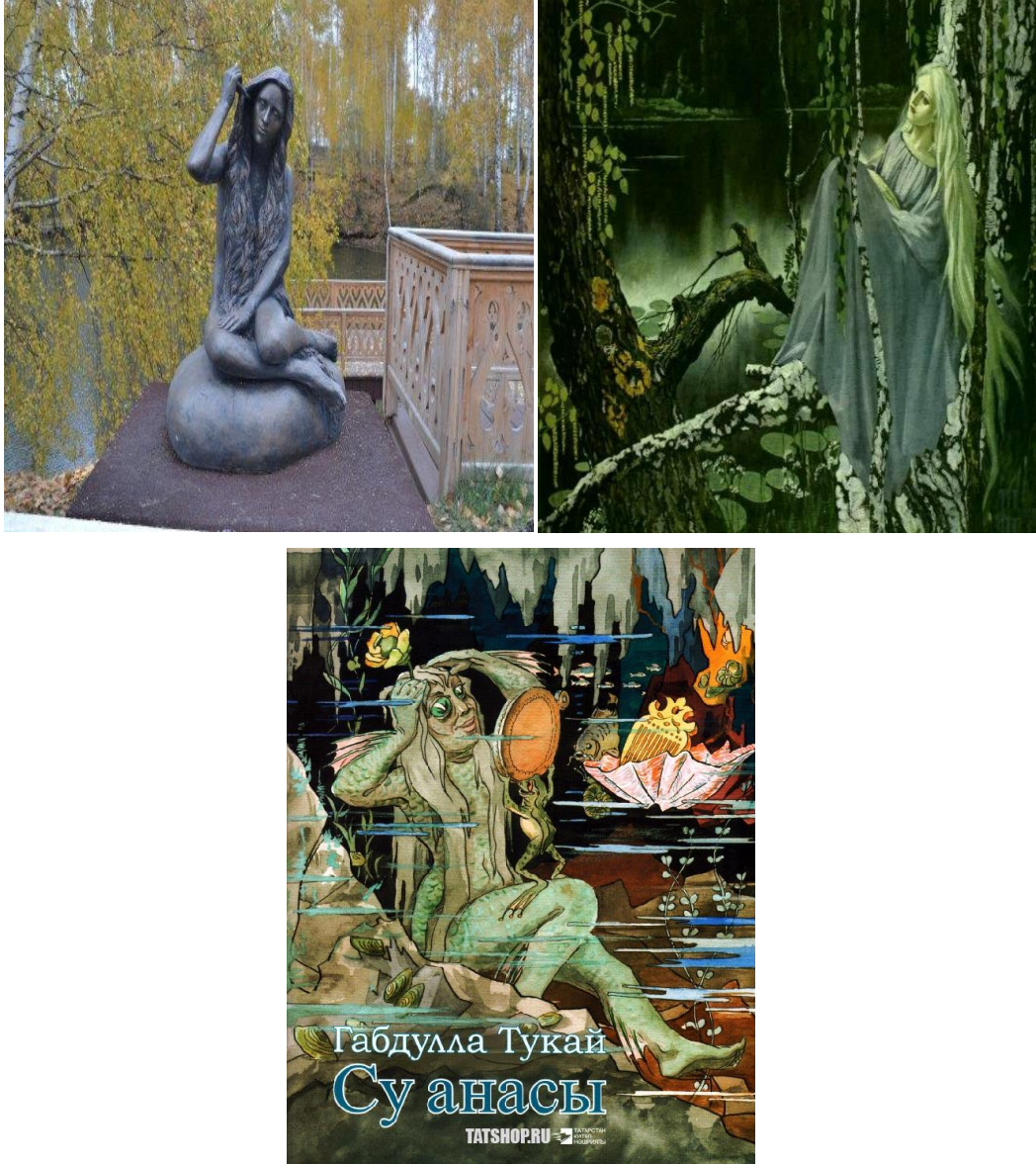
Resim 1-2-3-4-5: Bauman Sokağı, Kazan, Tataristan ve Tukay Müzesi, Kırlyay Arça Rayonu Tataristan.